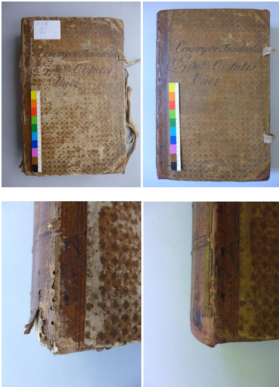
A kötés részletei restaurálás előtt és után

V. 1-f, Püspökvác Mezőváros Tanácsának iratai – Conscriptio Fundualis Episcopalis Civitatis Vac – Püspökvác Város telkeinek összeírása, 1775-1806 , 726 oldal, kötés mérete 25x38x8 cm