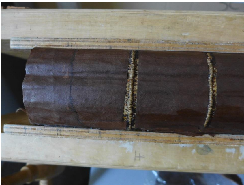
A könyvtest gerince barna merített papírral megkasírozva

A dokumentum restaurálás előtti állapota: Félbőr kötés papír táblákon, bőr sarkakkal. A bőr vaknyomásos léniázással díszített. A borítópapír ecsettel mázolt, majd dúcra nyomott területű mintájú. A nyomás feltehetően bronzporral készült. Előtábláján vasgallusz tintával írt címadat közvetlenül a borítópapíron. Arcnál két pár kötőszalag.